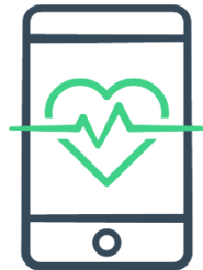
Technologie & soins chaleureux