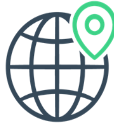
TransForm Integrated Community care