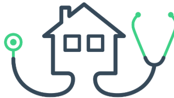
Infections liées aux soins