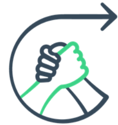
Compétences en santé