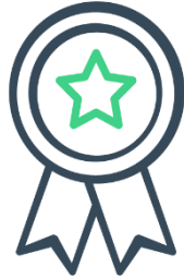
Bourses pour professionnels