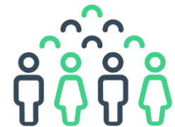
Préparer l'avenir de l'emploi