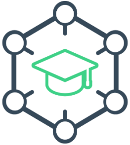
Chaires 1ère ligne